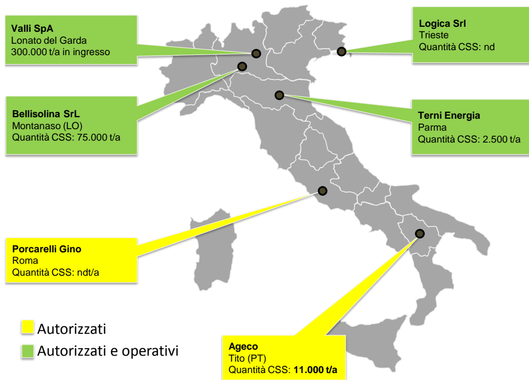
Figura 1 Siti degli impianti di produzione di CSS combustibile